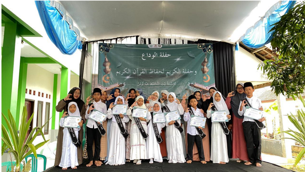
Gambar 2. Terlaksananya Wisuda Tahfidz Perdana.