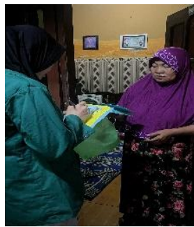
Gambar 1. Kegiatan menarik iuran dirumah warga RT 15 Geluran Taman Sidoarjo

Kelima, sinergi kesadaran dan sistem, Hasil menunjukkan bahwa kesadaran warga dan sistem pengelolaan saling berkaitan. Transparansi yang baik meningkatkan kepercayaan, sehingga mendorong partisipasi yang lebih tinggi.