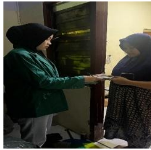
Gambar 2. Kegiatan menarik iuran dirumah warga RT 15 Geluran Taman Sidoarjo

Proses pengumpulan iuran dilakukan oleh saya sendiri sebagai perwakilan dari Karang Taruna desa, yang dalam pelaksanaannya dapat pula melibatkan perangkat RT atau petugas yang ditunjuk oleh warga. Kegiatan ini merupakan bentuk kontribusi finansial masyarakat untuk mendukung kebutuhan lingkungan dan operasional kelembagaan kemasyarakatan sebagai mitra pemerintah, sesuai dengan ketentuan yang berlaku. Dalam perspektif Asset-Based Community Development (ABCD), kegiatan ini memanfaatkan aset sosial berupa partisipasi warga dan peran aktif Karang Taruna dalam pengelolaan iuran. Namun, berdasarkan hasil evaluasi pada tahap destiny (implementasi dan evaluasi), ketercapaian tujuan program masih belum optimal. Hal ini terlihat dari pelaksanaan penarikan iuran pada tanggal 20 Februari 2026 pada warga ke dua RT 15 Geluran Taman Sidoarjo ini masih belum memenuhi kewajiban pembayaran alias (menunggak).