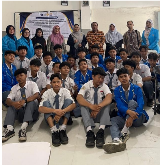
Gambar 2. Bersama Dosen Pembimbing.

Kegiatan Pengabdian Masyarakat ini sudah di lakukan sesuai tahap yang di rencanakan dari awal perencanaan dan pelaksanaan survey. Kegiatan ini di lakukan bersama masyarakat, tim Dosen dan Mahasiswa. Pada Gambar 2 dan Gambar 3 adalah jalan nya kegiatan yang dilakukan pada saat pelaksanaan berlangsung.