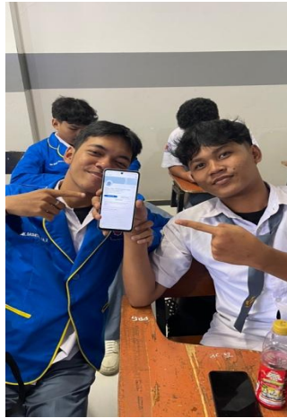
Gambar 4. Pengaplikasian Aplikasi LinkedIn.

Pada gambar 4 adalah kegiatan pengaplikasian aplikasi LinkedIn dimana aplikasi tersebut bertujuan sebagai perencanaan masa depan. Pada tahap ini siswa diharuskan untuk merencanakan karir masa depannya melalui aplikasi LinkedIn, siswa diarahkan menggunakan aplikasi serta proses mengisi data pribadi. Data yang di isi oleh siswa harus sesuai dengan pengalaman pribadi serta memasukkan data prestasi dan pengalaman. Hal tersebut agar mendapatkan peluang kerja yang tinggi.