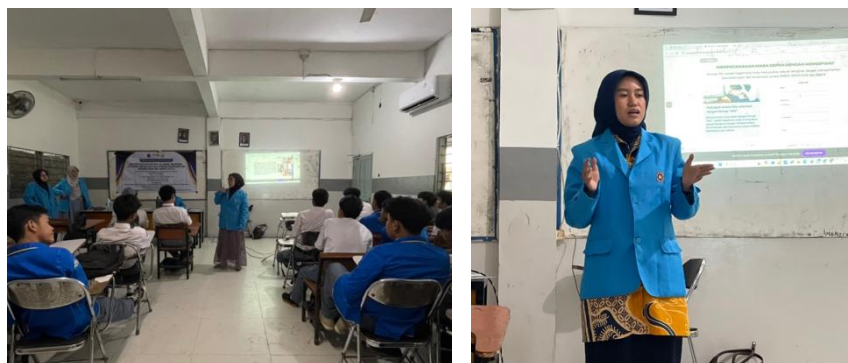
Gambar 3. Penjelasan Materi.

Pada gambar 2 kegiatan dokumentasi bersama dosen pembimbing dalam proses kegiatan PKM, pembimbing mengamati serta memberikan arahan agar pelaksanaan pengabdian ini dapat bermanfaat untuk siswa. Sehingga pelaksanaan PKM berjalan dengan lancar.