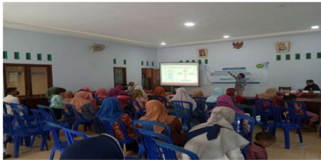
Gambar 1. Sosialisasi Bank Sampah