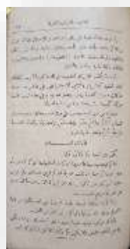
Gambar 2. Halaman Tengah