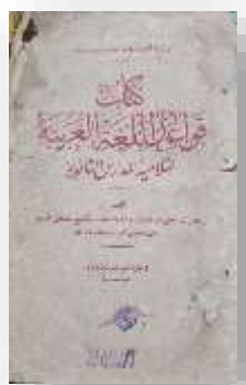
Gambar 1. Halaman Depan