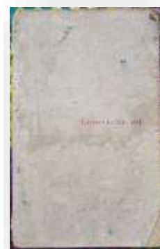
Gambar 3. Halaman Belakang

Secara fisik naskah berada dalam kondisi baik, menggunakan aksara arab dengan tinta berwarna hitam yang dapat dilihat pada gambar halaman. Jumlah halaman pada naskah terdiri