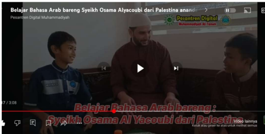
Screenshoot Video Belajar Bahasa Arab Bareng Syeikh Palestina di Youtube

“Selain kuis online, terkadang ketika pembelajaran kita menonton dan kadang malah membuat video untuk lebih bisa memahami pelajaran yang diberikan oleh para asatidz”.