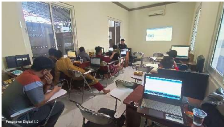
Gambar Penerapan Pembelajaran Skill Digital di Pesantren

“ada beberapa pembelajaran yang menggunakan media pembelajaran berbasis IT seperti powerpoint, video maupun kuiz online, untuk membantu para santri agar mempercepat pemahaman santri dalam pembelajaran”.